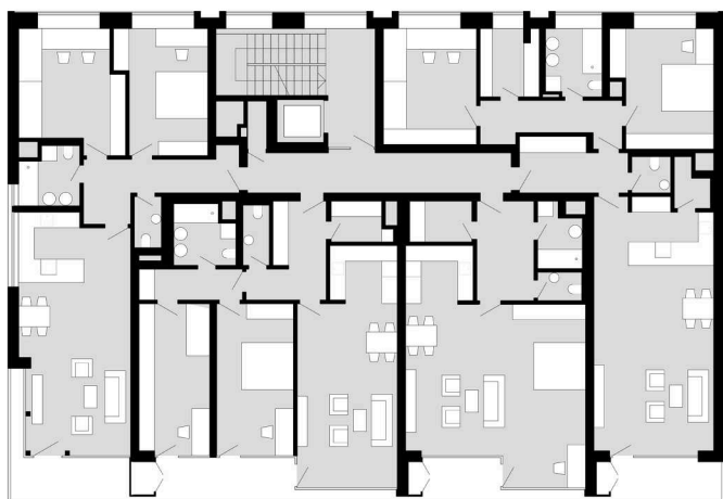
+ půdorys typického patra